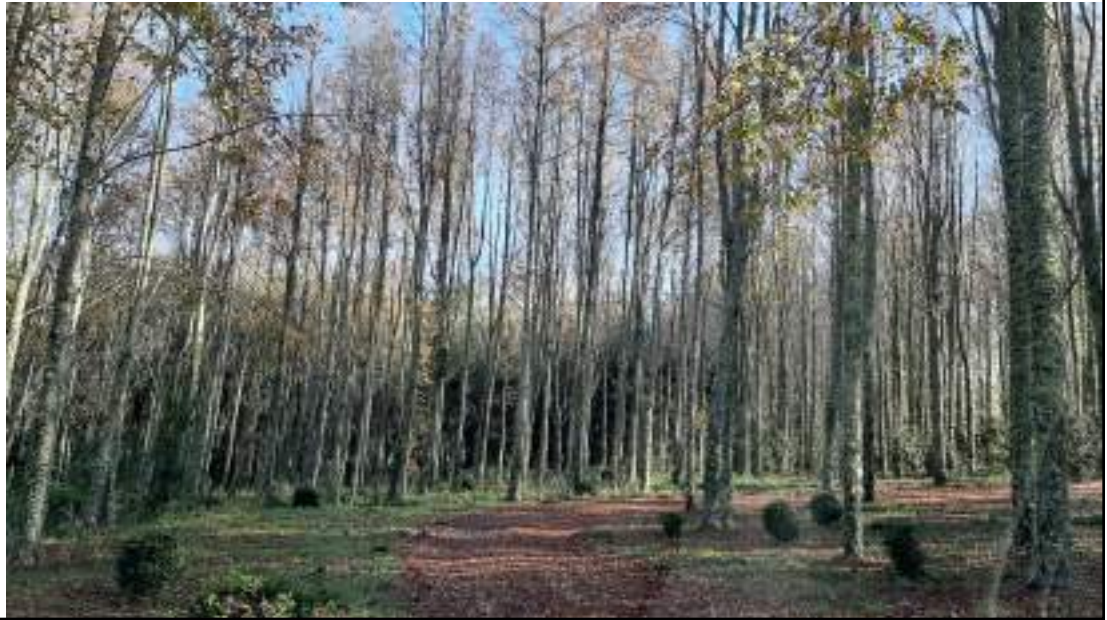
Plantación Catanlí 2001-2002-2003-operacional